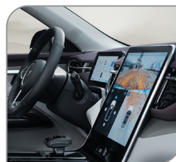
Камера 540° (круговая камера 360° + камера «сквозь» 180°)