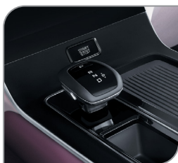
8-ступенчатый автомат AISIN