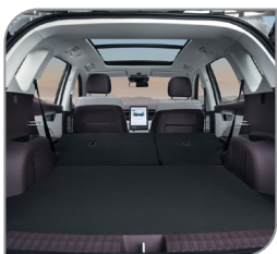
Багажник 560 или 1345 литров при сложенных задних сиденьях