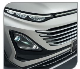
Автоматический свет фар с регулировкой по высоте и задержкой выключения